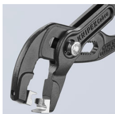
Полный доступ к хомуту благодаря поворотным захватам