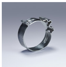
Хомут для шлангов с упором