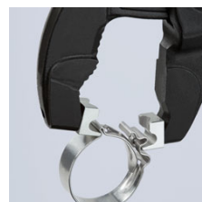
Установка хомута на шланг с упором