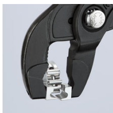
Раскрытие хомута для шланга с упором