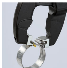
Установка хомута на шланг без упора