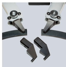
сменные вставки для наружных и внутренних колец